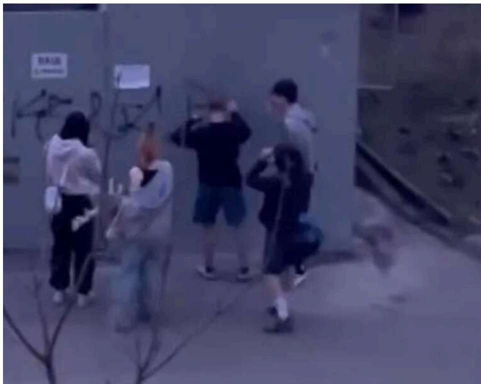
Російський реп, лайка та понівечений ринок: на Оболоні розшукують підлітків-вандалів

Підлітки з балончиками фарби тероризують Оболонський район. Вони серед білого дня розмальовують будинки, підземні переходи та навіть місцевий ринок "Лілія" - а на зауваження відповідають лайкою. Мешканці зазначають: подібне трапляється не вперше, і закликають батьків відповідальніше ставитися до виховання своїх дітей. До пошуків цих юних вандалів долучаються навіть народні депутати.