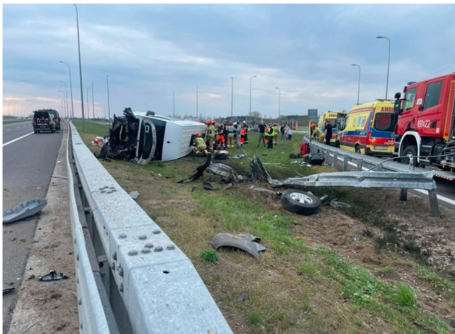
У Польщі мікроавтобус з українцями потрапив у ДТП.

Нагадаємо, на Канарських островах автобус потрапив у ДТП. Одна людина загинула і 27 отримали поранення.