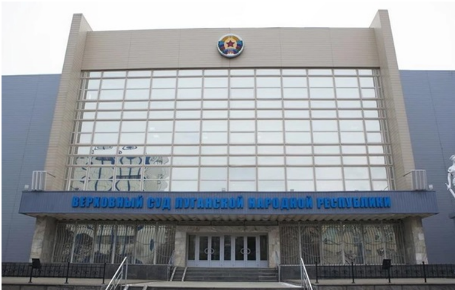
Фото: Російські ЗМІ (ілюстративне фото)

Так званий "верховний суд ЛНР" ухвалив обвинувальний вирок щодо 47-річного громадянина Республіки Польща