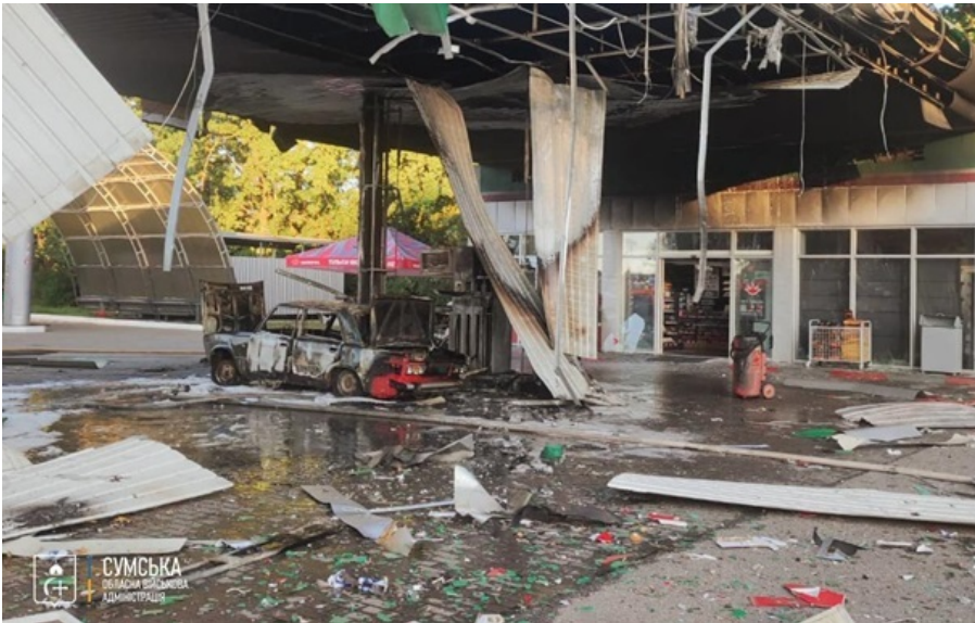
На Сумщині росіяни атакували АЗС

Крім того, російський безпілотною атакував цивільну автівку у Миколаївській сільській громаді.