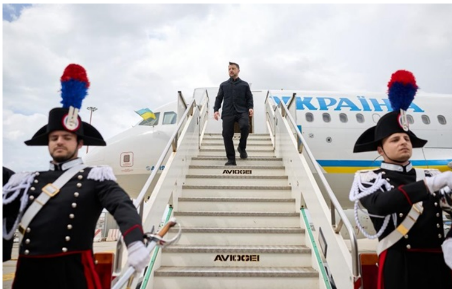
Володимир Зеленський перебуває у європейському турне

Програмою візиту передбачена участь українського лідера в церемонії вручення міжнародної премії Чотири свободи.