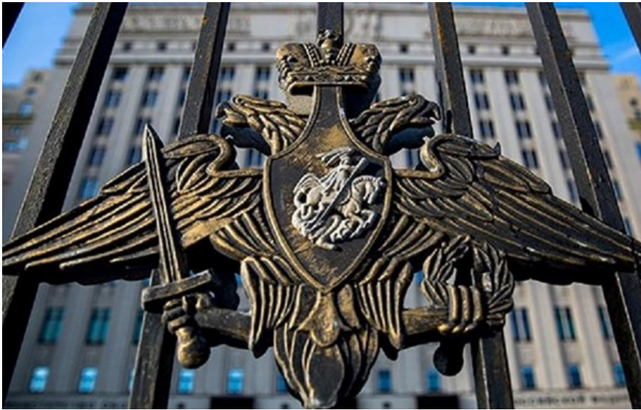
Фото: Міноборони РФ (ілюстративне фото)

Міноборони РФ пригрозило Європі через дрони для України