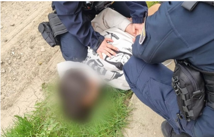
Патрульні поліцейські затримали хлопця

Хлопець раптово під час уроку дістав пістолет та здійснив два постріли – одним поранив свого однокласника.