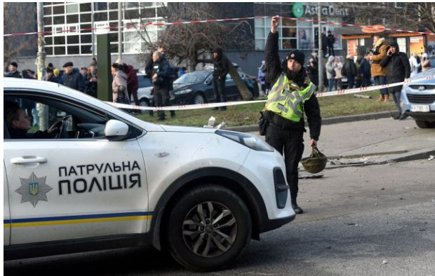
Фото ілюстративне: Нн Закарпатті учень влаштував стрілянину у школі

Сьогодні вранці, 16 квітня, учень 9 класу дістав на уроці пістолет і двічі вистрелив, поранивши однокласника. Подія сталася в одній із шкіл Ужгородського району.