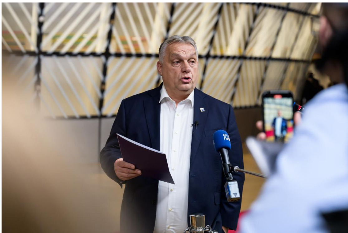
У Орбана залишився контроль над багатьма сферами в країні