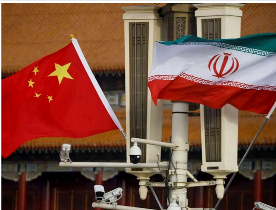
Китайський слід у ракетних атаках Ірану: як супутник TEE-01B допомагав КВІР полювати на бази США

Іран використав китайський розвідувальний супутник для спостереження за американськими базами – й робив це ще до ракетних та дронів ударів по них.