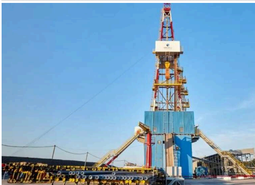
Мільйони на хімреагентах: в «Укргазвидобуванні» викрили схему розкрадання 295 мільйонів гривень через «фірми-прокладки»

В «Укргазвидобуванні» викрили схему розкрадання понад 295 млн грн на закупівлях хімреагентів за завищеними цінами.