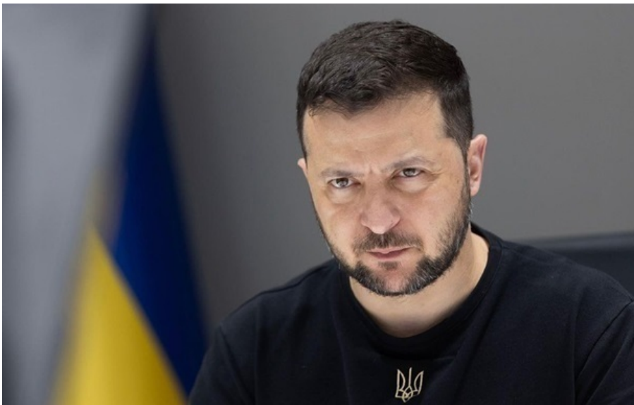
Президент України Володимир Зеленський

Союзники оголосили про нові пакети підтримки, зокрема у сфері ППО, дронів та логістики, а також підтвердили внески до спільних оборонних програм.