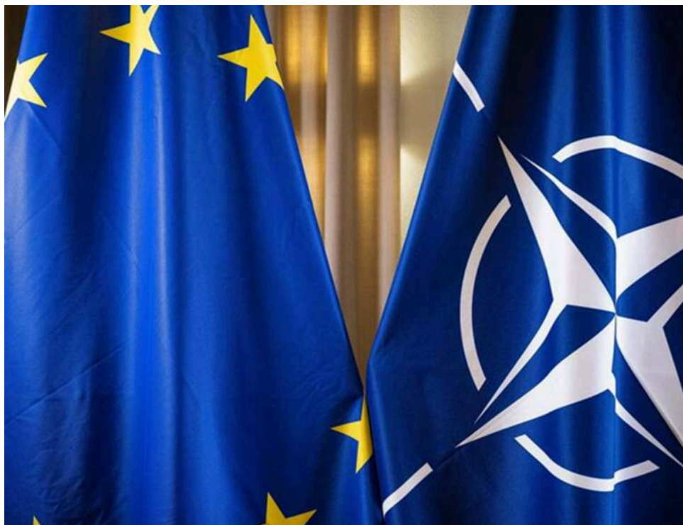
Європа й Канада обговорюють створення «Європейського НАТО», - WSJ

Європа та Канада ведуть переговори про створення «Європейського НАТО» на тлі погроз Трампа вивести США з Альянсу, пише The Wall Street Journal з посиланням на джерела.