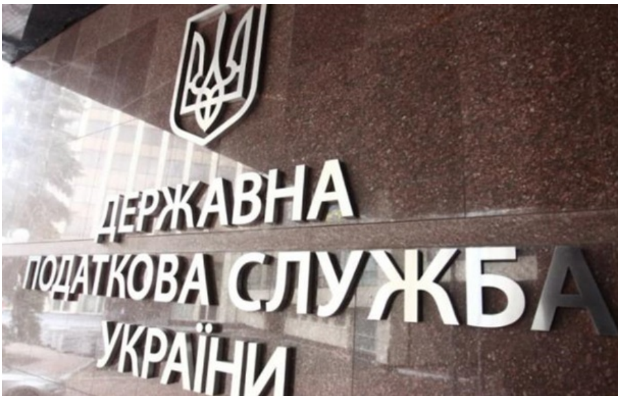
(ілюстративне фото)

Українці сплатили майже 3 млрд грн податку на нерухомість у першому кварталі