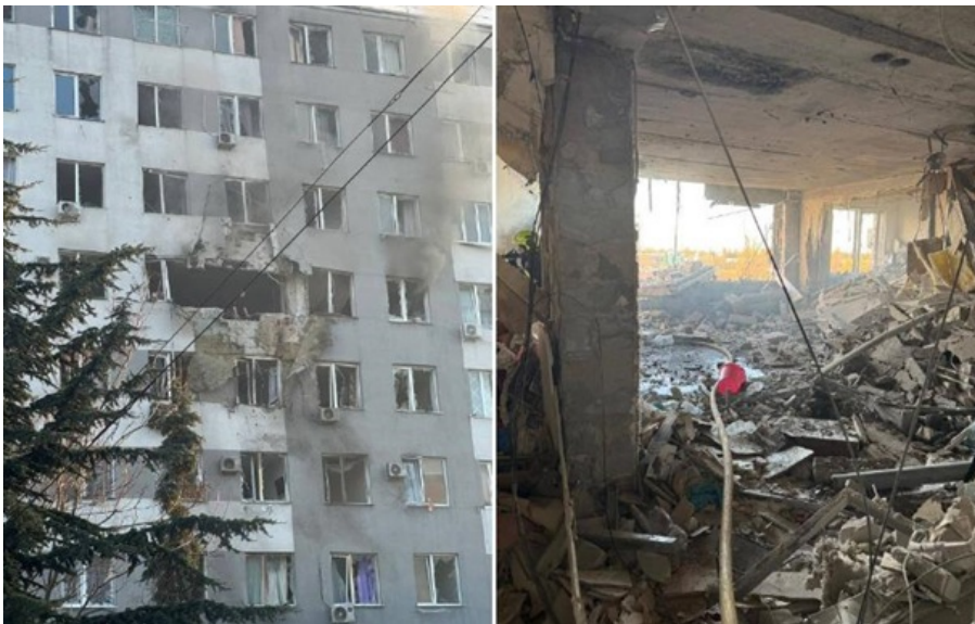
Наслідки удару росіян по Одесі

За попередньою інформацією, постраждало четверо людей. Пошкоджені квартири на кількох поверхах - з п'ятого по сьомий.