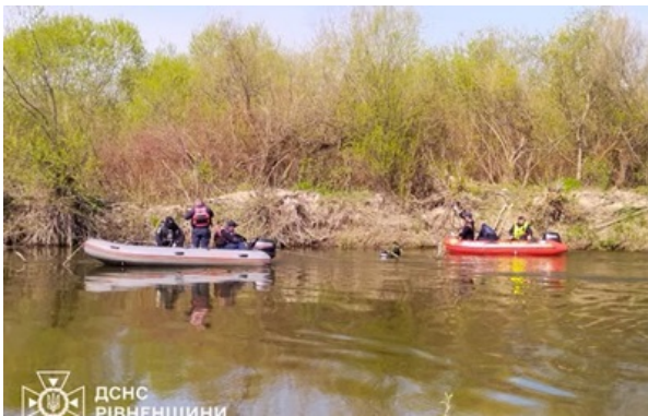
На Рівненщині у річці знайшли тіло зниклого хлопчика

Десять днів тому, 5 квітня, було знайдено тіло його молодшого брата, після чого всі зусилля були спрямовані на розшук старшої дитини.