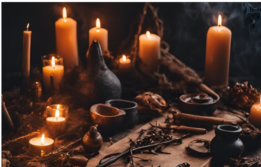
Фото: pixabay.com (ілюстративне фото) Держдума РФ не заборонила рекламу послуг відьом та чаклунів

Документ, внесений ще на початку 2025 року, пропонував обмежити діяльність астрологів, магів, тарологів, нумерологів та інших представників окультної сфери.