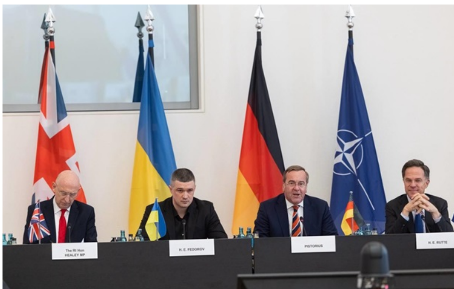
Учасники 34 засідання у форматі Рамштайн

ЗСУ на полі бою не лише утримують позиції, але і нарощують тиск. А втрати Росії досягли рівня, що перевищує темпи її мобілізації.