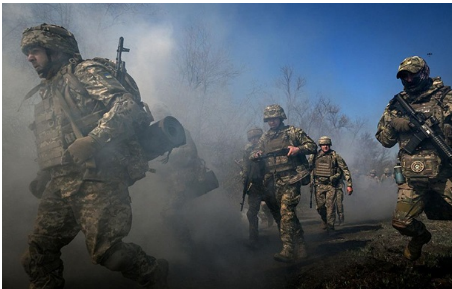
ЗСУ стримують російські атаки на сході і півдні України

Понад третина російських атак сконцентрована поблизу Покровська у районах 11 населених пунктів.