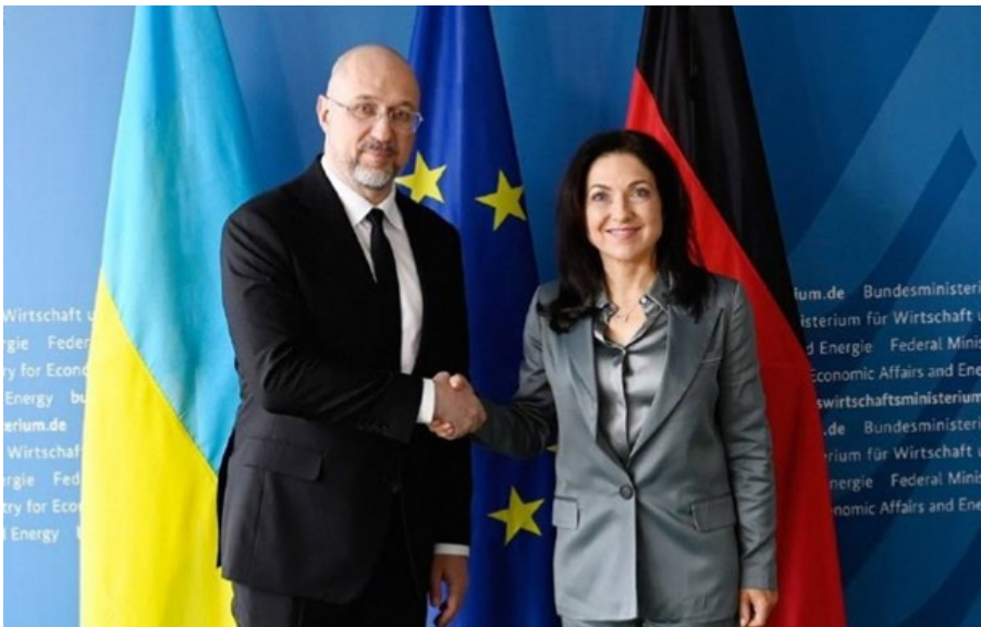
Шмигаль з федеральною міністеркою економіки та енергетики Німеччини Катериною Райхе

Раніше Шмигаль запропонував Німеччині створити спільний механізм формування стратегічного резерву енергетичного обладнання для України за участі Німеччини та інших партнерів.