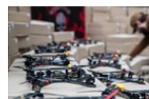
Британія надасть рекордну партію дронів Україні

ЄС запустить застосунок для перевірки віку в інтернеті