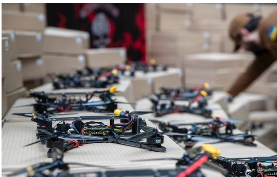
Україні потрібні мільйони дронів для стримування наступу Росії