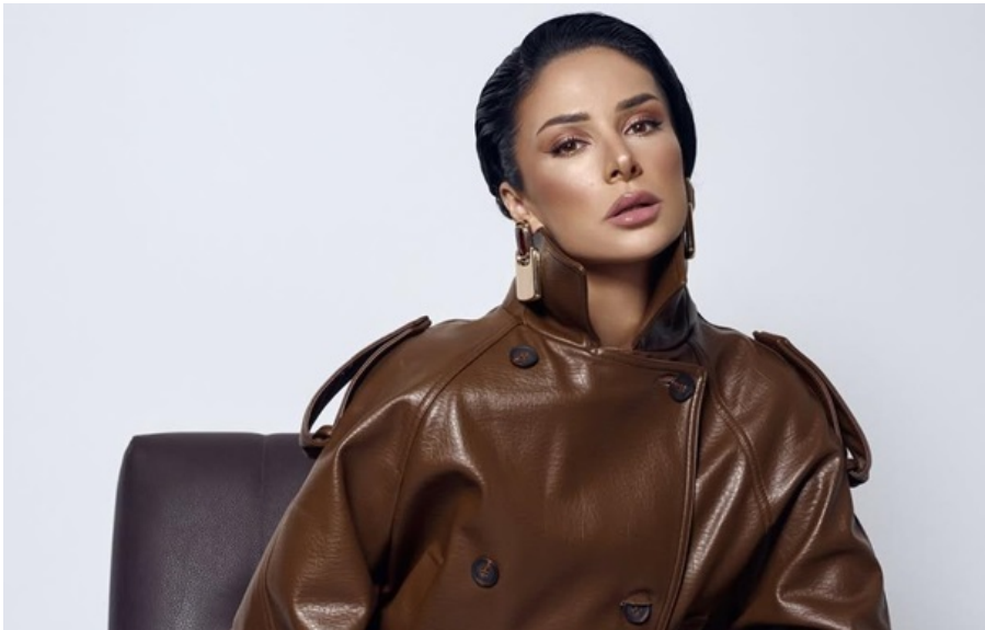
Фото: instagram.com/zlata.ognevich Злата Огневич

Вона зазначила, що на той момент український шоу-бізнес працював інакше, а система фінансування участі в конкурсі була значно менш прозорою, ніж сьогодні.