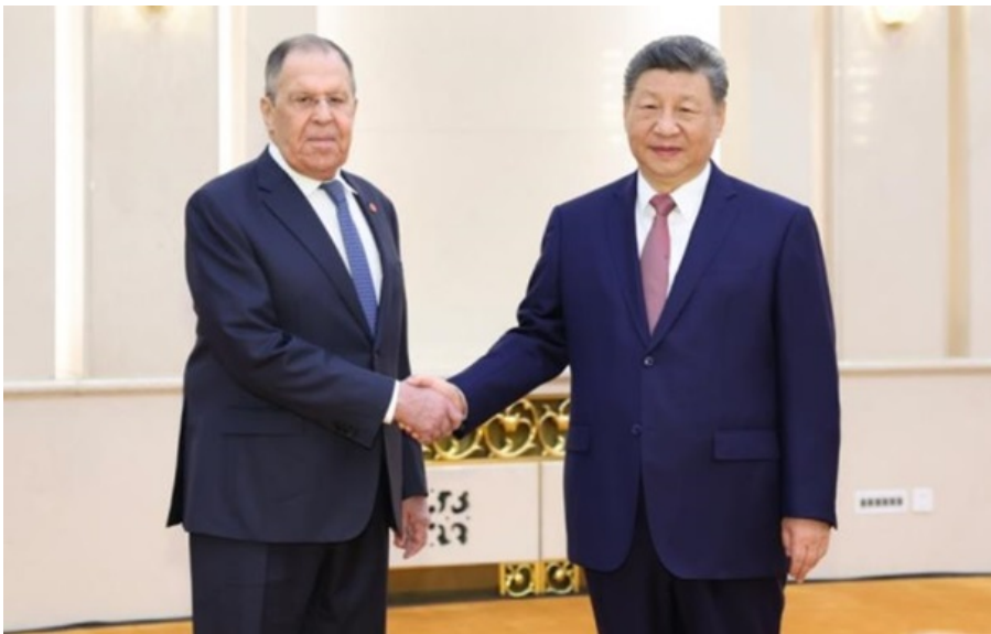
Сі Цзіньпін і Сергій Лавров зустрілися в Пекіні 15 квітня

Пекін і Москва мають тісно координувати свої дії у міжнародних організаціях і розвиватися разом, вважає китайський лідер.