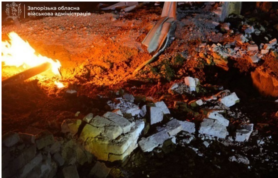
Наслідки ударів РФ по Запоріжжю

По області оголошено загрозу ударів безпілотників, а також швидкісних ракет. На світанку прогрімилі повторні вибухи.