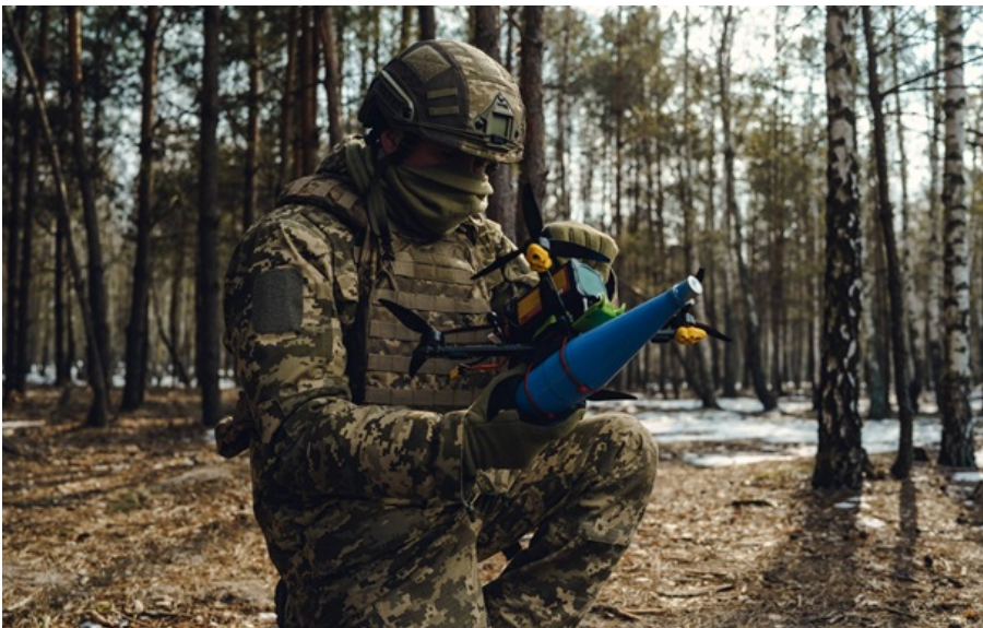
Росія знову порушувала великоднє перемир'я

Російські війська традиційно не дотримались "режиму тиші" і зміцнили свої позиції на фронті.