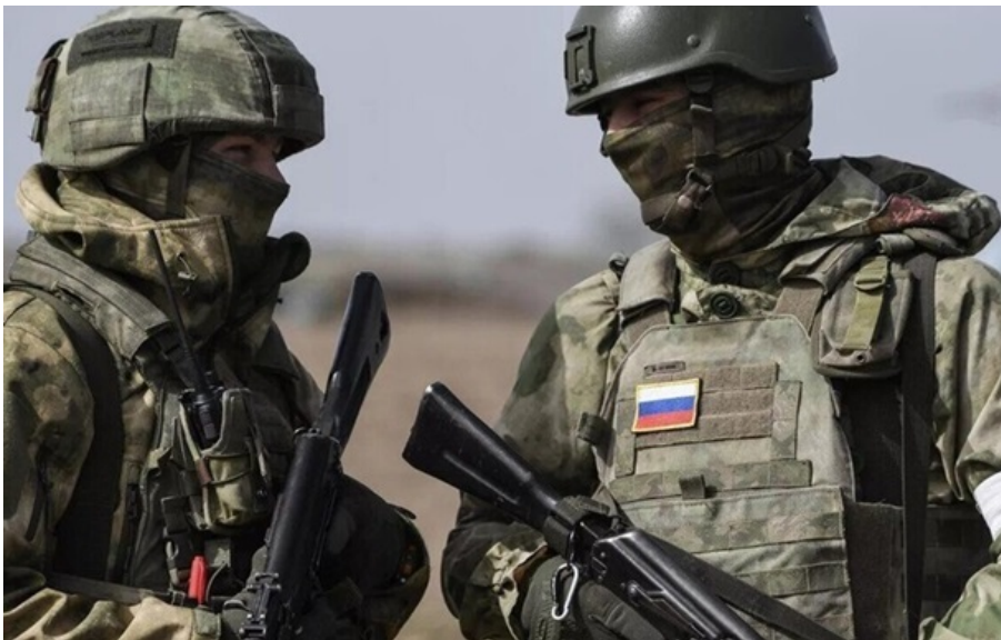
(ілюстративне фото)

РФ продовжує створювати буферну зону вздовж кордону на Сумщині