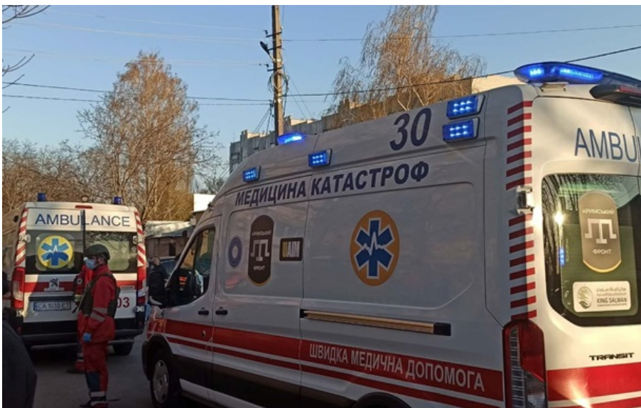
Росіяни атакували Черкаси

Надвечір росіяни спрямували на область "шахеда". Оборонці знешкодили частину цілей, однак є трагічні наслідки.