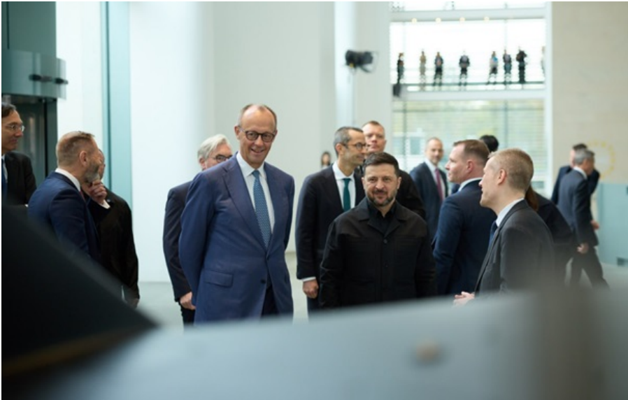
Володимир Зеленський та Фрідріх Мерц у Берліні

Щодо цих систем уже підписані меморандуми про можливе створення спільних українсько-німецьких підприємств.