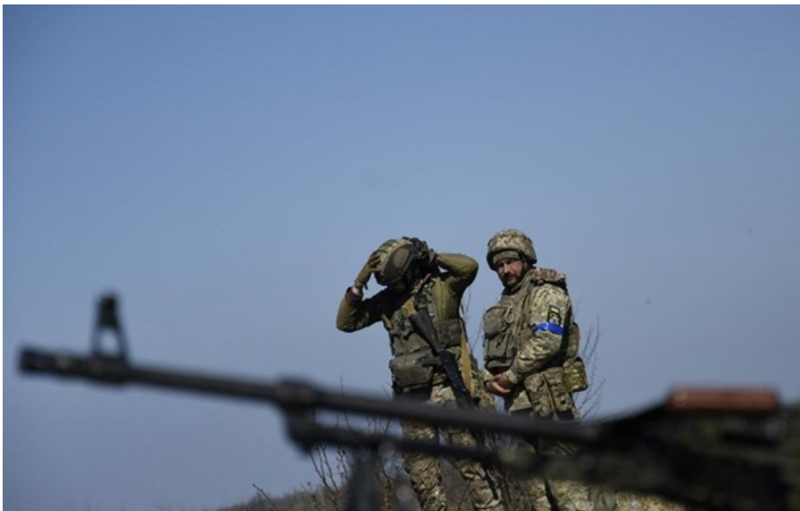
ЗСУ ведуть важкі бої на сході і півдні України

Найбільшу активність російська армія проявляє в районі Покровська, де ЗСУ вже відбили 11 атак.