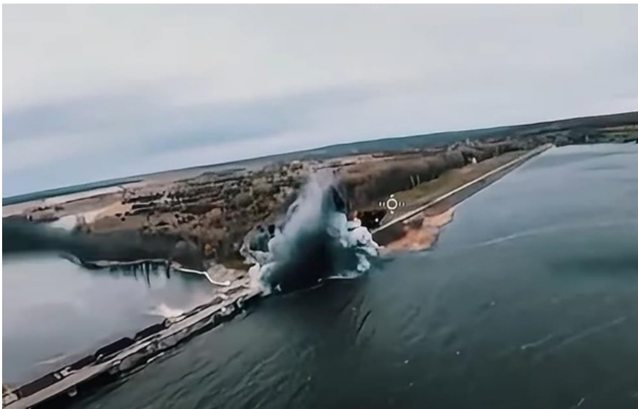
Ситуація повністю моніториться

Дамба не пошкоджена. Скид води відбувається у плановому контрольованому режимі.