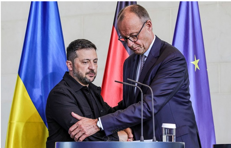
Володимир Зеленський та Фрідріх Мерц

Німеччина підтримує євроінтеграційний курс України, водночас членство не може відбутися "швидко і в повній мірі".