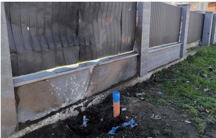
Місце вибуху в Броварах

Одного з фігурантів затримали на вокзалі у місті Могилів-Подільський Вінницької області, звідки він намагався виїхати за межі України.