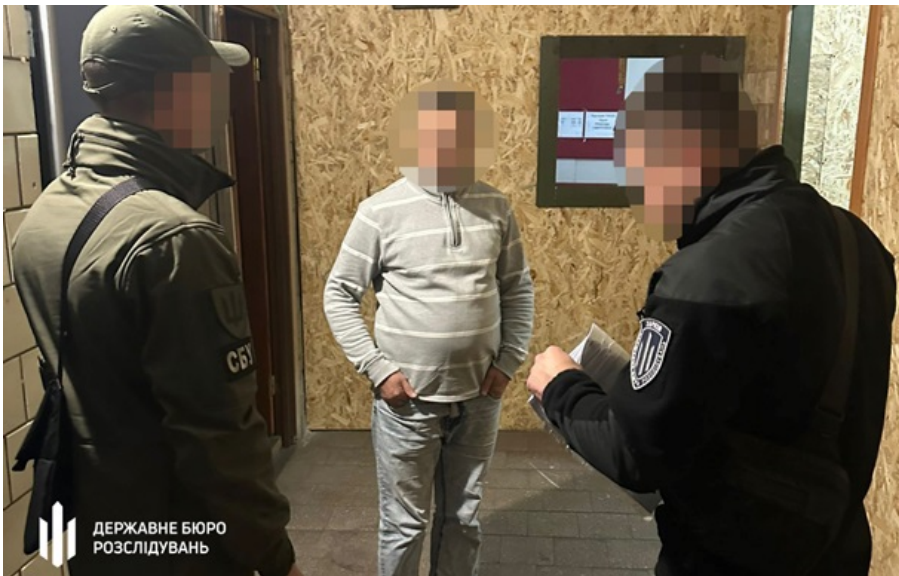
ДБР завершило розслідування щодо військових з Харківського напрямку

Загалом у групі було шестеро осіб: командир роти, командир взводу, головний сержант, двоє військових та цивільний.