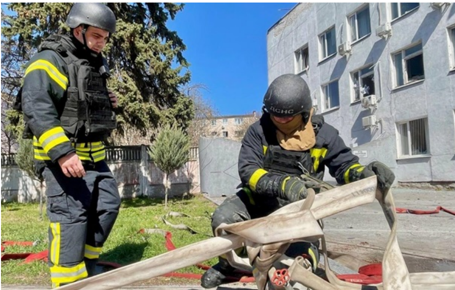
У Чернігові є влучання по адмінбудівлях

Чернігів увесь день перебуває під ударами російських дронів. Крім того, зберігається загроза балістики.