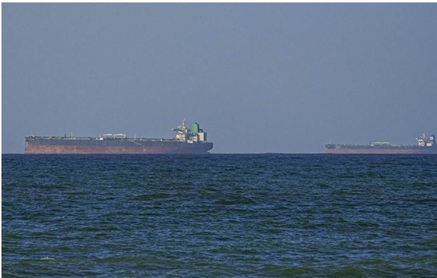
Криза в Ормузі може спричинити зростання цін на продукти

Якщо рух суден через Ормузьку протоку незабаром не відновиться, світ ризикує протягом року постати перед різким прискоренням продовольчої інфляції.