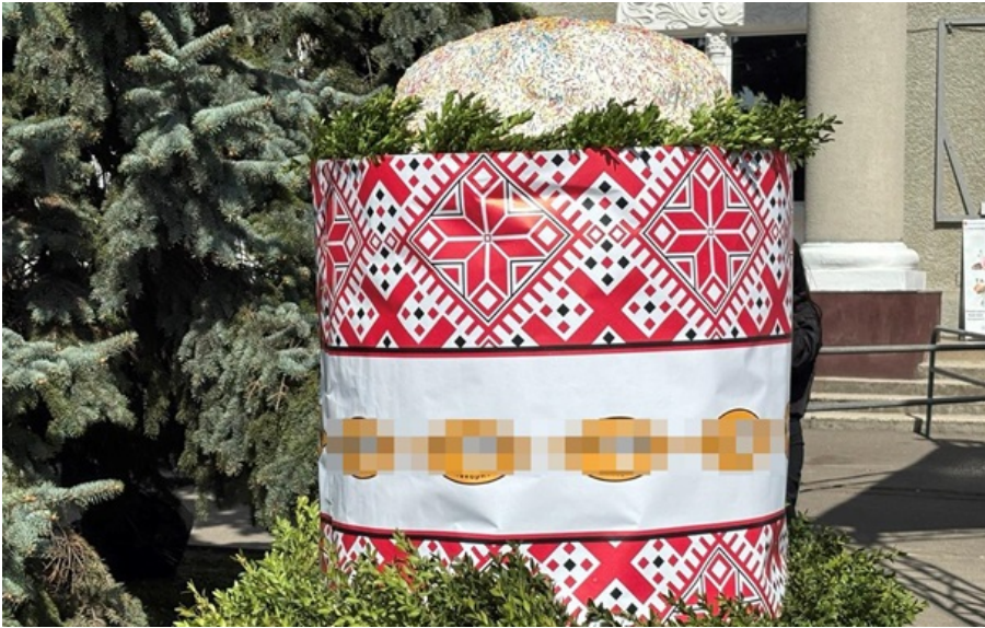
У Нововолинську до Великодня спекли 200-кілограмову паску

Після фіксації рекорду частування роздали всім охочим, водночас збираючи донати на потреби військових - зокрема для 39-го зенітного ракетного полку.