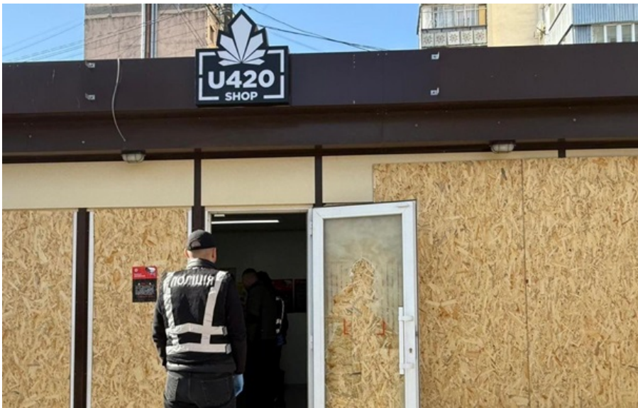
У магазинах U420 проводять обшуки

Магазини підозрюються у торгівлі наркотиками та відмиванні грошей. Документування їх діяльності тривало з грудня 2025 року.