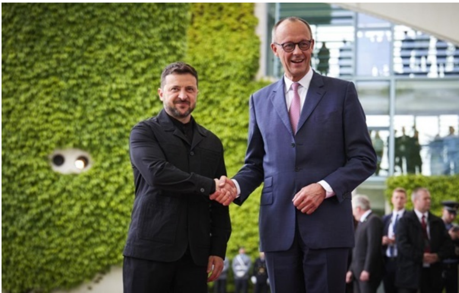
Зеленський і Мерц під час зустрічі в Берліні в травні 2025 року

Напередодні Володимир Зеленський анонсував переговори з європейськими лідерами щодо створення спільної системи захисту неба.