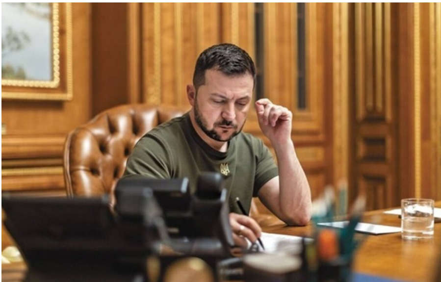
Володимир Зеленський схвалив закон про продовження дії військового збору

Продовження справляння військового збору у чинних розмірах дозволить залучати до держбюджету близько 140 млрд гривень на рік.