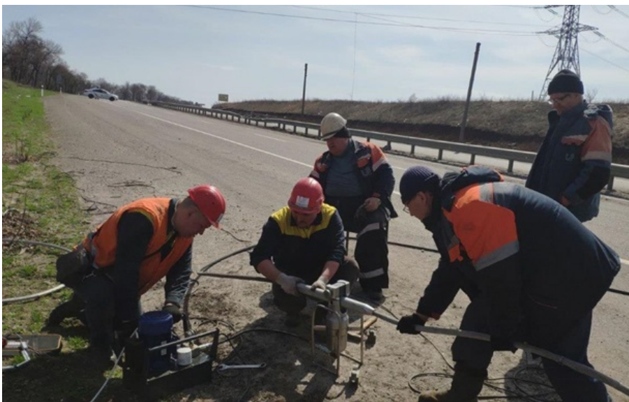
В енергетиків додалося роботи після сьогоднішньої ночі (архівне фото)

Скрізь, де це наразі дозволяють безпекові умови, вже тривають аварійно-відновлювальні роботи, запевнили в Укренерго.