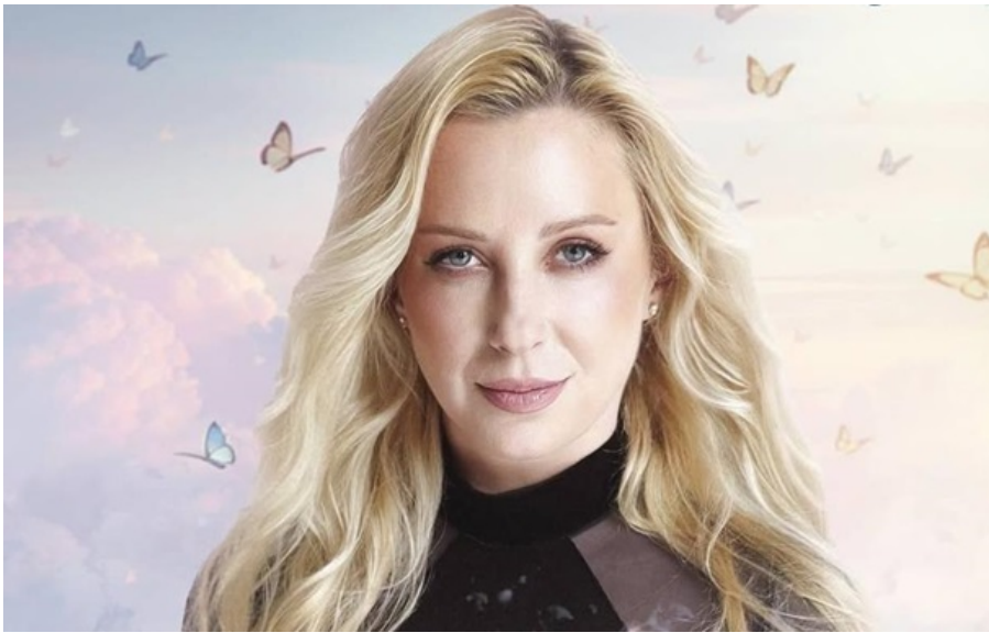
Фото: instagram.com/tonya_matvienko Тоня Матвієнко

Виконавиця зазначила, що пісня стала для неї особливою, адже викликала особисті асоціації та відгукнулася емоційно.