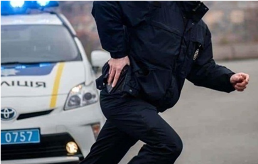
(ілюстративне фото) Обставини вибуху встановлюються

Правоохоронці затримали підозрюваних у причетності до інциденту; інформація про потерпілих ще уточнюється.