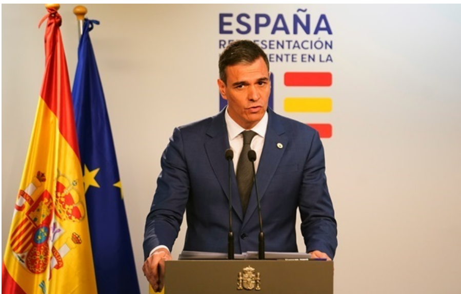
Прем'єр-міністр Іспанії Педро Санчес

Гomez заперечує свою провину, а прем'єр наполягає, що справа є замовленням з боку його політичних опонентів.