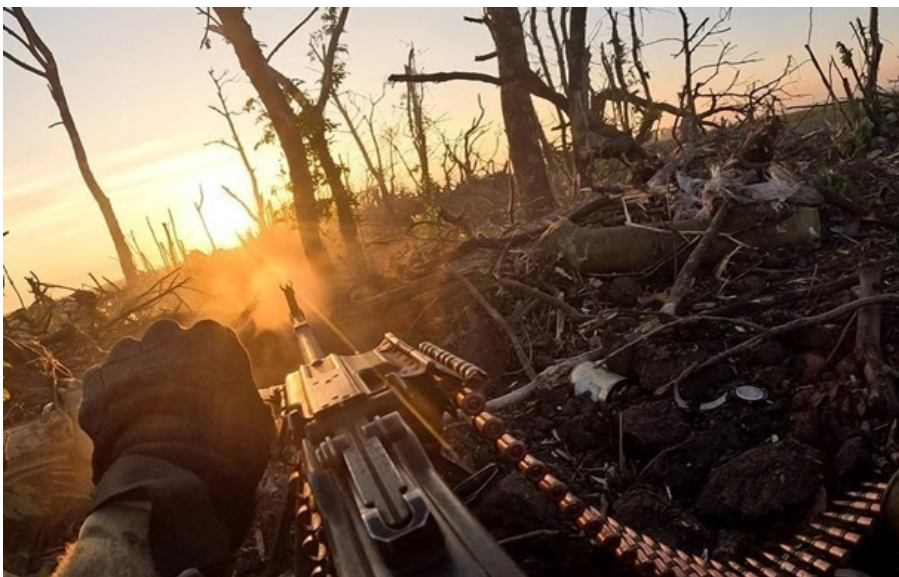
Ворог має просування на Сумщині

За добу площа червоної зони в зазначених населених пунктах зросла на 19,44 кв. км, сірої зони – на 52,01 кв. км.