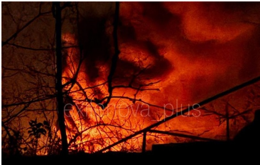
Пожежа на підстанції у Мелітополі

У Мелітополі вкотре уразили підстанцію, залишивши окупантів без електрики. Гучно було і в різних частинах Криму.