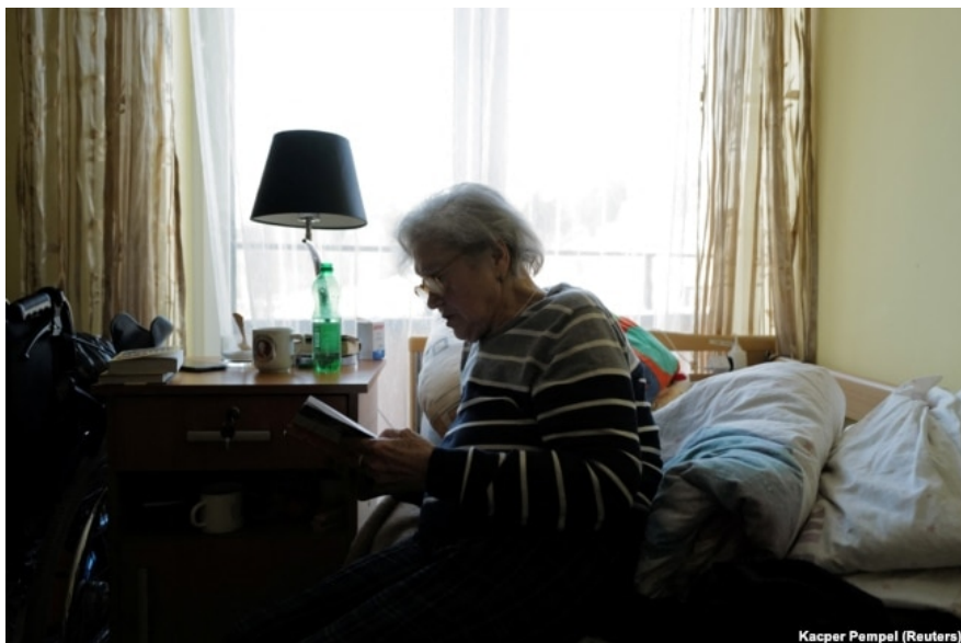
Прихисток для українців у Польщі, 10 лютого 2023 року

Одинокі люди або пари без дітей становлять 37% воєнних мігрантів. А 17% – це родини з дорослими дітьми, тобто декілька поколінь, серед яких немає неповнолітніх.