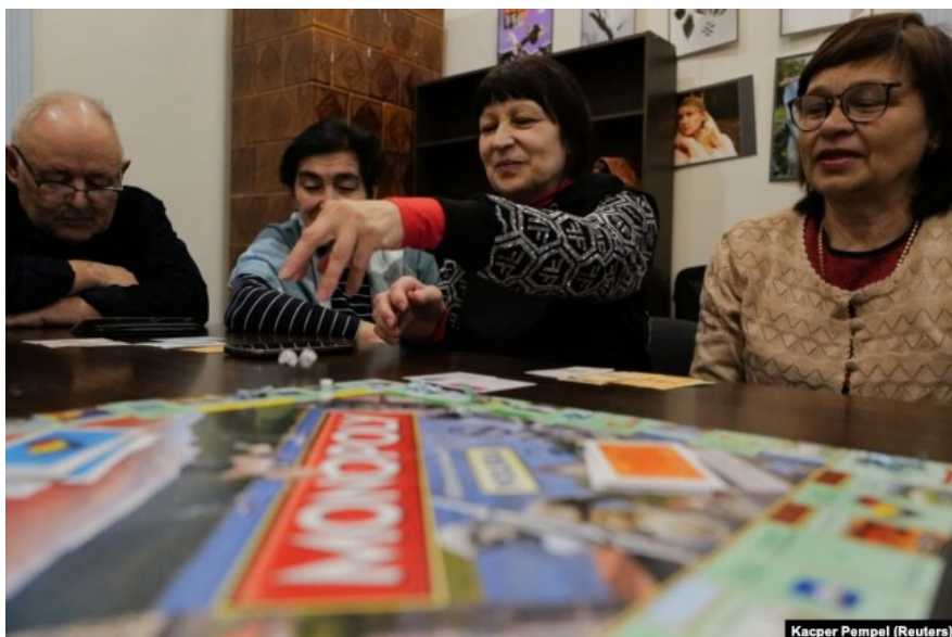
Українські біженці у Польщі, Краків, 1 лютого 2023 року

Читайте також: Мерц попросив Зеленського стримати наплив молодих українських чоловіків до Німеччини