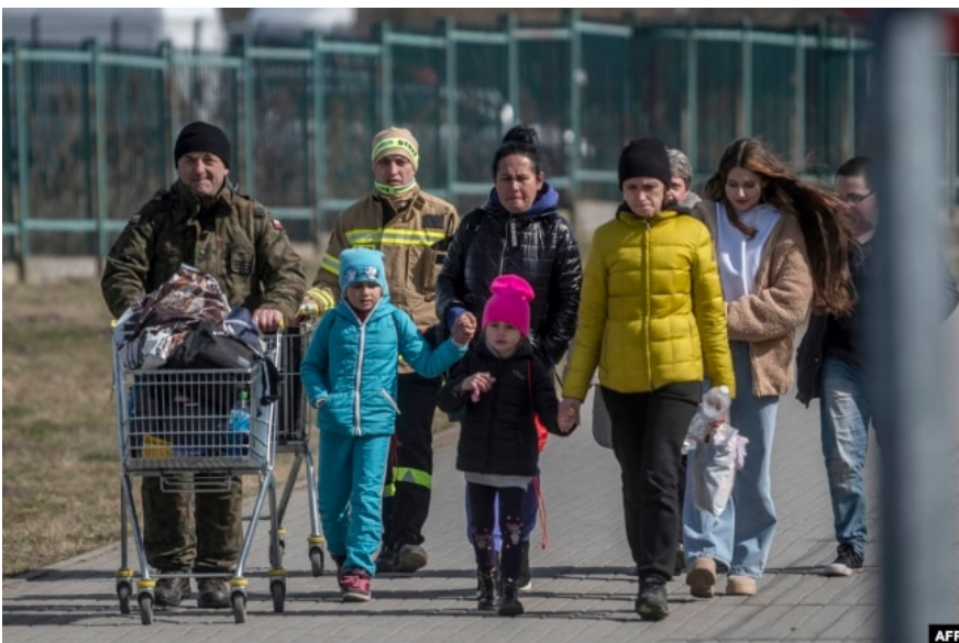
Українсько-польський кордон, 27 березня 2022 року

Загальна мета рішення, щоб зменшити виїзд школярів разом із батьками. За кількістю тимчасових захистів, які отримують українські діти віком 14-17 років, ми бачимо зменшення після вересня 2025-го року. Основні виїзди цієї категорії школярів відбуваються, як правило, влітку, після закінчення навчального року в Україні. Тобто повністю проаналізувати ефективність цього рішення можна буде вже у 2026-му році».