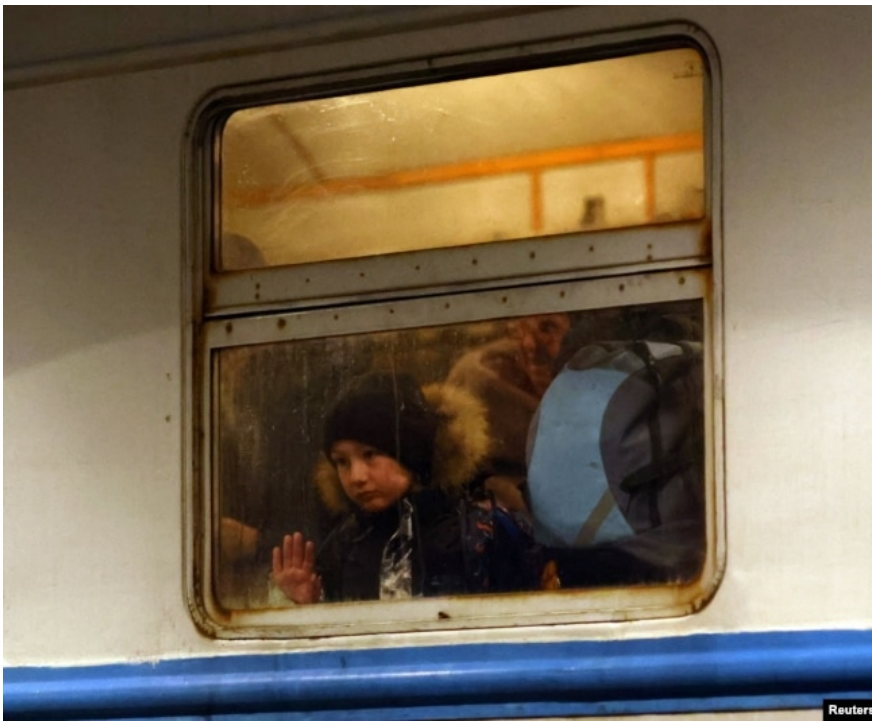
Вокзал у Перемишлі, Польща, 2022 рік

«З хорошого – за календарний рік в нас все-таки зменшилася кількість виїздів через західні кордони. Якщо у 2024 році прикордонні служби оцінювали чисті виїзди у 460 тисяч осіб, то у 2025 році – вже 300 тисяч. Тобто люди продовжують виїжджати, але тенденція йде на зменшення, навіть незважаючи на те, що у 2025 році дозволили виїзд чоловікам від 18 до 22 років».