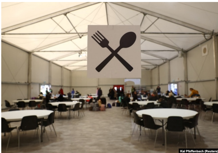
Прихисток для українських біженців у Німеччині, 2 березня 2023 року

Читайте також: Які наслідки відкриття владою виїзду за кордон чоловікам віком від 18 до 22 років