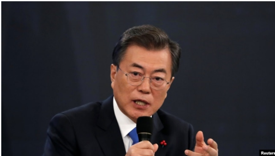
Президент Кореи Мун Чжэ Ин

СМИ, на митинги в 13 городах страны вышли 80 тысяч человек, а на охрану порядка власти отправили 12 тысяч полицейских. Митингующие были одеты в костюмы из сериала "Игра в кальмара", которые символизировали, что люди зарабатывают из последних сил. В декабре смертность от коронавируса в Южной Корее достигла рекордного показателя – 104 случая за сутки (всего с начала пандемии – более 4 тысяч). Заболеваемость между тем постепенно идет на спад, сейчас фиксируют около 7000 случаев за день. Власти ограничили работу заведений общепита до 9 часов, а также запретили гражданам находиться в общественном месте в компании более 4 человек, причем все они должны быть вакцинированными. Президент Кореи Мун Чжэ Ин извинился перед народом за "отмену возвращения к нормальной жизни".