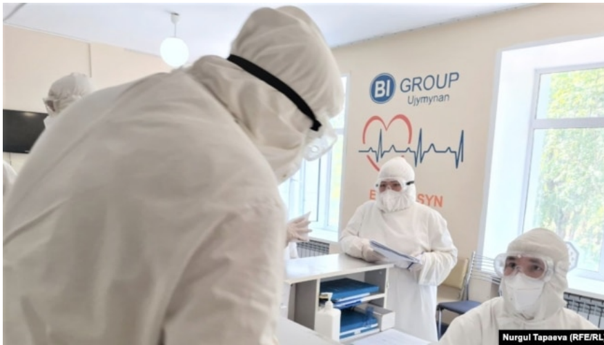
Ковидный центр в Нур-Султане

По официальным данным, общая заболеваемость в Казахстане в декабре снизилась в 3 раза, а число стационарных больных – в 1,7 раза. Министр здравоохранения Алексей Цой заявил, что Казахстан "идет по оптимистическому сценарию".