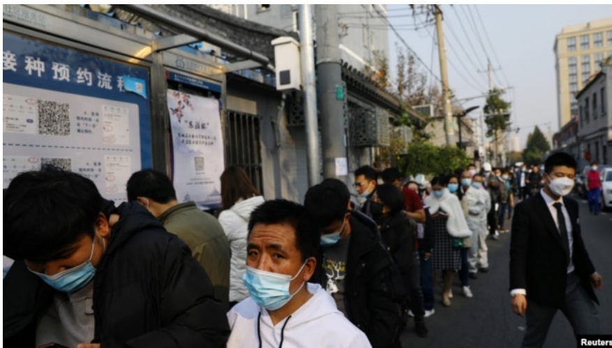
Очередь на вакцинацию в Пекине

С начала пандемии в Китае умерло от ковида 4636 человек, но подавляющее большинство случаев относится к началу эпидемии. В 2021 году в стране от COVID-19 умерли три человека – все в январе, причем летальный случай 13 января стал первым за последние 8 месяцев. Вакцинация от коронавируса в Китае началась еще в декабре 2020 года, но массовость приобрела лишь минувшим летом, когда китайские власти объявили о вакцинации 1 млрд жителей, всего в стране было создано семь вакцин, две из которых получили одобрение ВОЗ. К ноябрю в Китае получили вакцину 76% жителей.