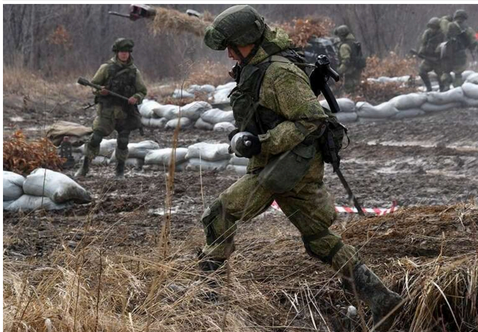
Ситуація на фронті: 61 бойове зіткнення, Покровський та Костянтинівський напрямки залишаються найгарячішими точками

Від початку доби агресор 61 раз атакував позиції Сил оборони. Майже половина з усіх боїв сталася на Костянтинівському та Покровському напрямку.