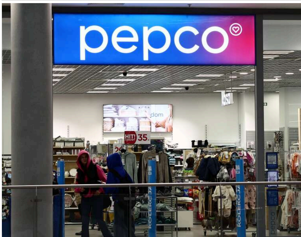
Польський гігант Рерсо заходить в Україну: перші магазини мережі відкриваються вже до кінця року

Польська мережа Рерсо планує вийти на ринок України. Перші магазини можуть відкритися вже в поточному році.