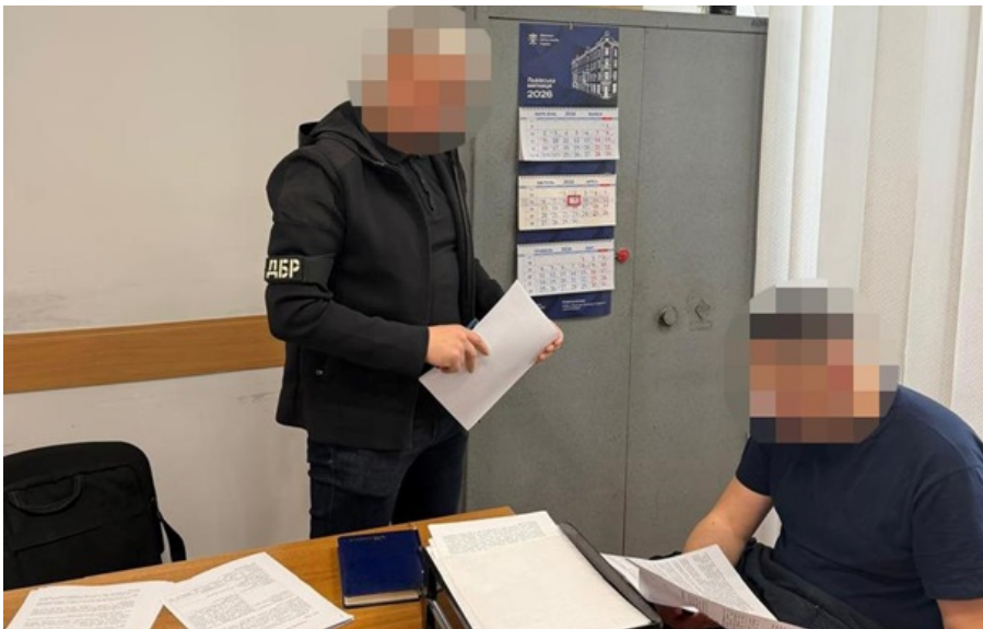
ДБР повідомили про підозру інспектору Львівської митниці

Він безперешкодне ввезення зарядних станцій, акумуляторів та ігрових консолей на майже 7 млн грн з Польщі без сплати митних платежів.